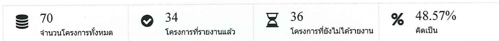
กราฟแสดงภาพรวมโครงการ