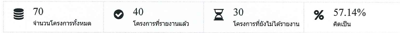
กราฟแสดงภาพรวมโครงการ