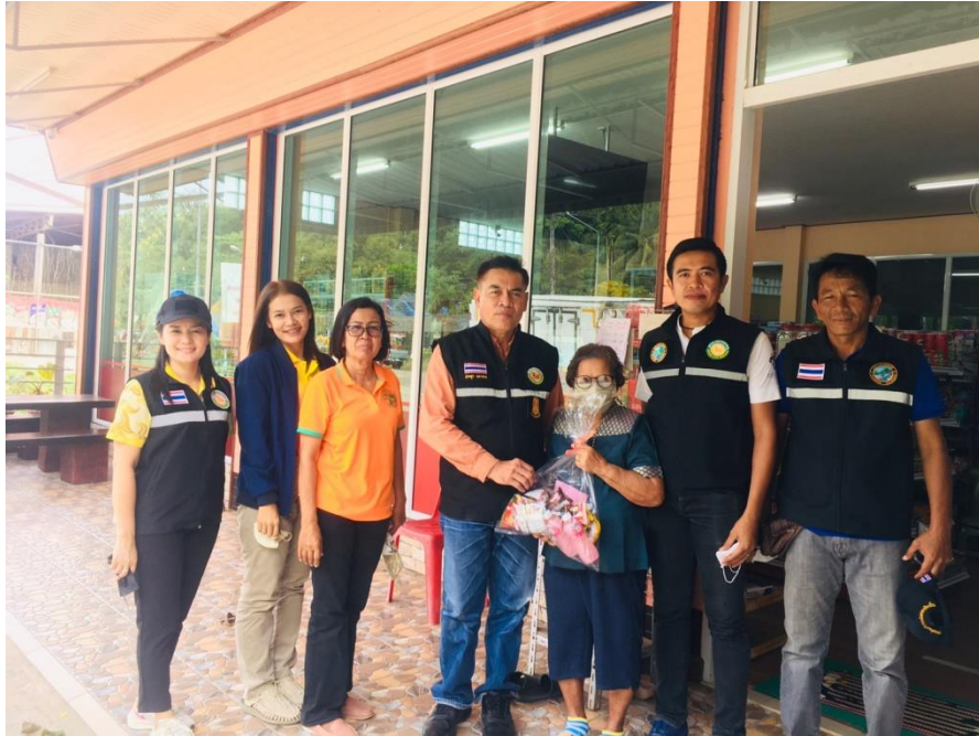
ภาพประกอบโครงการ ออกเยี่ยมผู้สูงอายุ ผู้พิการ ประจำปี ๒๕๖๕